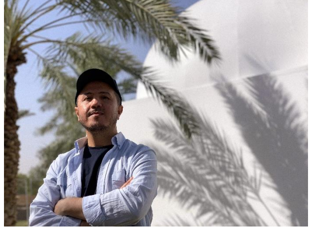
صورة الفنان – الرياض، 2023